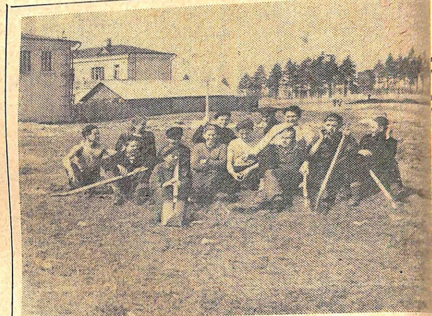
Это от них, комсомольцев 50-х, приняло эстафету нынешнее поколение молодежи. Они заложили заводской парке это — их след на земле, их вклад в процветание нашего народа.

Особого внимания требуют сегодня вопросы идейно-воспитательной работы. Недавно все про-