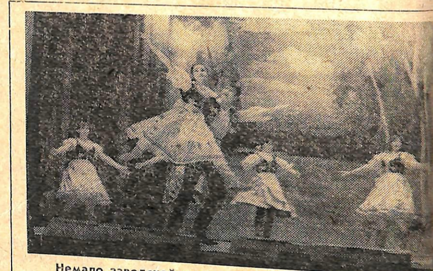
Немало заводской молодежи занимается в кружках художественной самодеятельности ДК «Октябрь».